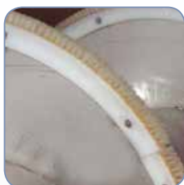
Spazzole per la pulizia